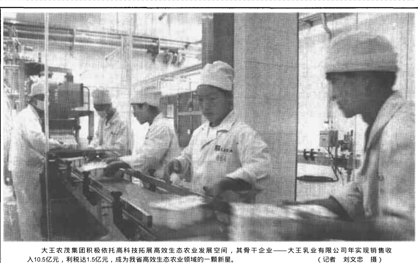
大王农茂集团积极依托高科技拓展高效生态农业发展空间，其骨干企业——大王乳业有限公司年实现销售收入10.5亿元，利税达1.5亿元，成为我省高效生态农业领域的一颗新星。

本报讯 10月23日至24日，全省公安车辆管理工作现场会议在我市召开。会上，东营市车管所等单位介绍了在加强车管工作等规范化建设方面的经验，实地考察了市车管所和部分基层车管所。与会人员对我市高度重视车辆管理工作，建立健全行之有效的车管工作规范化建设目标和考核机制，队伍建设和业务工作取得的显著成效给予了高度评价。