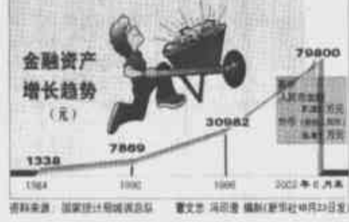
资料来源:国家统计局城市司 董文忠 冯利强 编制(新华社北京23日电)

据新华社北京10月23日电(记者 邱红杰)由国家环保总局和有关部门共同编写完成的《中国城市垃圾填埋气体收集利用国家行动方案》,将助城市从垃圾填埋中获益。