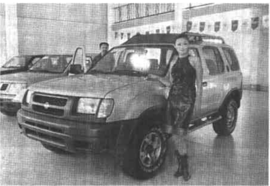
10月17日,胜利油田光达综合服务公司暨郑州日产汽车东营专卖店开业庆典隆重举行。光达公司继一汽丰田越野车、金杯通用、雪佛兰汽车建立特约服务后,今年5月又与郑州日产公司签定了东营地区一级销售代理协议,建立了日产汽车四位一体销售服务中心。公司现在是东营区行政事业单位车辆定点维修(装饰)单位,胜利油田多家单位的定点维修厂,同时也是胜利石油管理局的入网企业。

制而成的特色火锅,得到了“全国绿色餐饮企业”的荣誉称号,它仍以优质的服务,低廉的价格及各种优惠政策,从而得到了油城消费者的青睐。(王成军)