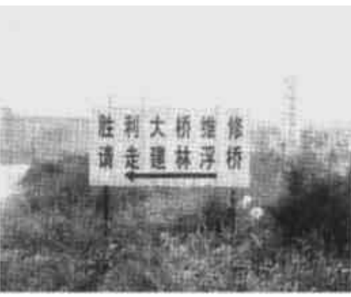
日前笔者从河口返回东城途中,发现一个道路指示牌,上写“胜利大桥维修,请走建林浮桥”。笔者感到奇怪:来时经过胜利大桥并未见维修呀。经打听原来这个牌子是早先胜利大桥维修时竖的,但大桥早已维修好了,仍未拆除。听司机讲,本地司机路过时都知道胜利大桥早已修好,但外地的司机路过时却不知道,这个牌子很容易误导他们。(小田)

选择。广饶粮食部门以“粮食银行”为龙头,发挥得天独厚的网络、信誉和资金流、信息流、实物流等优势,开展“物流配送商”,大力发展农村服务业。从今年8月份开始,这个县粮食局成立了农村粮油服务社总社,实行三级管理,在各乡镇设立了分社,各行村大力发展连锁店,计划在今明两年内建立连锁店260处。服务社实行了“六统一”,即统一政策、统一库存、统一价格、统一配送、统一质量、统一管理,确保优质产品和优质服务。连锁店均向全社会公开了联系电话、监督电话,群众一个电话,所需商品就送到门上,连锁店一个电话,所需物资就会及时配送到位。截至目前,这个县粮油连锁店已发展到了23家,月销售收入70万元,成为促进广饶粮食企业快速发展的经济增长点。(张景伦 王建峰)