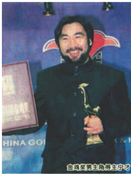
金鸡奖男主角得主守才

一洗长期以来一些国产影片,尤其是艺术片、获奖片凝重、压抑、灰暗的调子,《和你在一起》、《法官妈妈》、《美丽的大脚》等一批在本届金鸡百花电影节备受关注的热映新片,鲜明地凸现出一种明亮而轻快、现代而清新的风格,令人耳目一新。 历10余年之久,完成了这种风格之变的国产电影,开始向世界呈现出焕然一新的崭新形象。 改革开放之初,长期处于相对封闭状态的国产电影徐徐打开了与世界电影沟通、交流的大门。电影工作者们在急切地模仿、学习、比较、借鉴各国电影艺术的同时,也在苦苦寻觅着中国电影的独特个性与根基。当时一批优秀电影人,不约而同地选择了回望,希望通过对中国传统文化、生存方式的反思与展示,来寓言式地表达他们对现实生活某种理解,同时尽快完成对本民族电影艺术独特个性的确立。 沉重并不代表一个民族的精神,在我们的社会正越来越变得美好的时刻,人们更需要一种明亮的色彩、现代的意识,观众的这种需要,深深地融入了